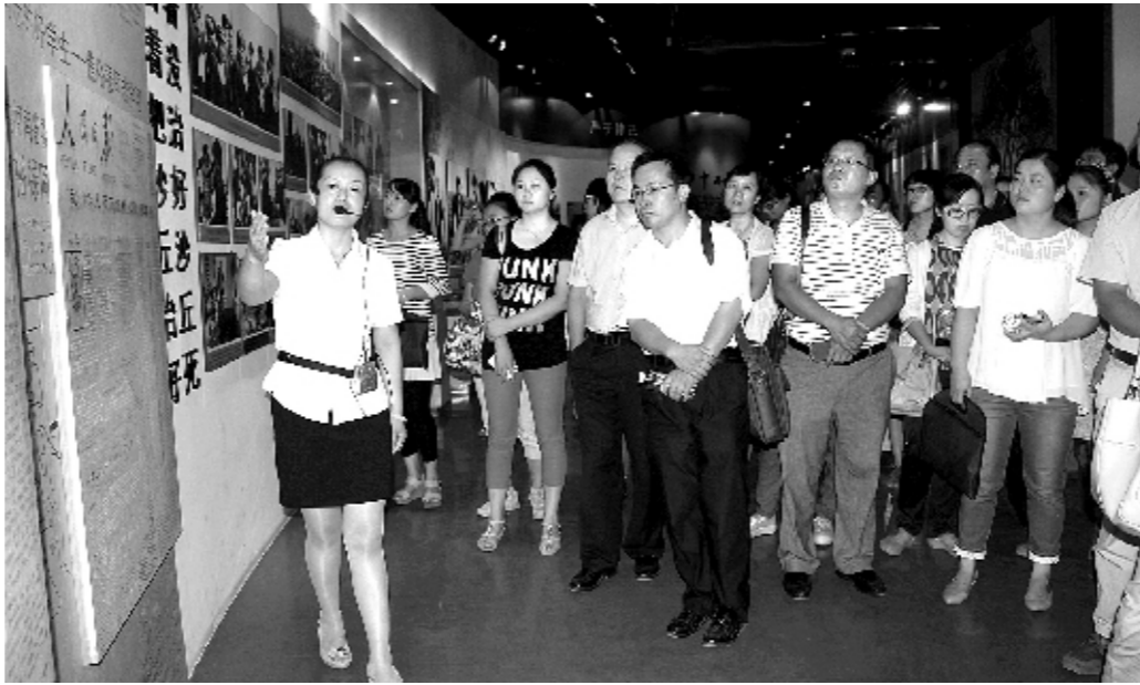
9月11日,河南省卫生厅直属机关党委结合全省开展的党的群众路线教育实践活动,组织省卫生厅第二十四期入党积极分子到焦裕禄纪念馆,重温焦裕禄精神,并把其作为“照镜子、正衣冠”的生动教材。图为讲解员向入党积极分子讲述焦裕禄同志全心全意为人民服务的先进事迹。

住院押金。南阳市各医疗卫生机构要执行住院费用“一日清单”制度,及时告知患者的医疗费用情况,对住院费用较多的,可分段结清个人自付部分。患者出院结算时,向医疗卫生机构支付城镇基本医疗保险或新农合报销后个人所承担的费用。患者结算完成后,医疗卫生机构应及时归还患者的有关证件。